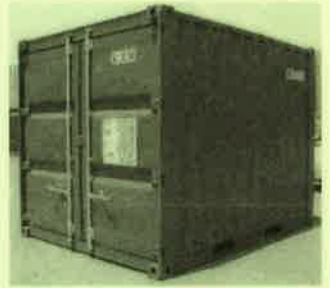
各サイズ/資料 (月額・TAX別)